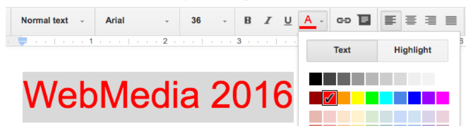
Figura 2.3. Imagem do editor de textos Google Docs, ferramenta de seleção de cores de texto.

Assim, Significantes indicam onde a ação do usuário deve ocorrer [Norman 2013, p. 13-14]. Norman ressaltou que, durante o processo de design , Significantes são mais importantes que Affordances [Norman 2013, p. 19]. No exemplo mostrado na Figura 2.3, é possível verificar que a aplicação RIA (Google Docs 3 ) apresenta uma paleta de cores, na qual cada cor significa onde a ação de seleção de cor ( Significantes ) deve ocorrer para seleção da cor específica para texto à esquerda.