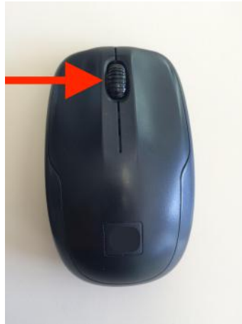
Figura 2.4. Foto de um mouse para exemplificar Mapeamento segundo seu mecanismo de rolagem.

Mapeamentos podem ser observados também em aplicações que gerenciam casas inteligentes, para que usuários controlem de maneira satisfatória a iluminação de um ambiente específico a partir de seu celular ou tablet [Norman 2013, p. 20-21].